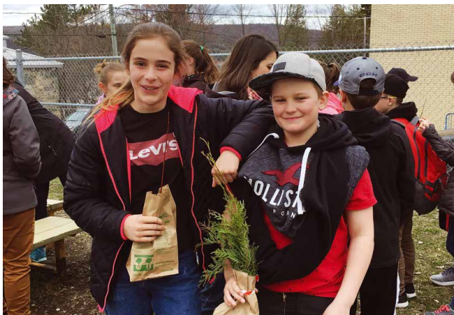
Remise de plants d'arbres aux élèves de l'école après la plantation symbolique

Avec la collaboration du ministère des Forêts, de la Faune et des Parcs, la Fondation de la famille Guérette ainsi que de plusieurs partenaires du milieu cet événement a été une réussite.